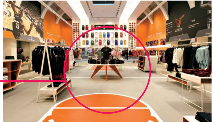
La pavimentazione richiama l'atmosfera di un palazzetto dello sport

Collection Men's, Women's, Boy's, Girl's