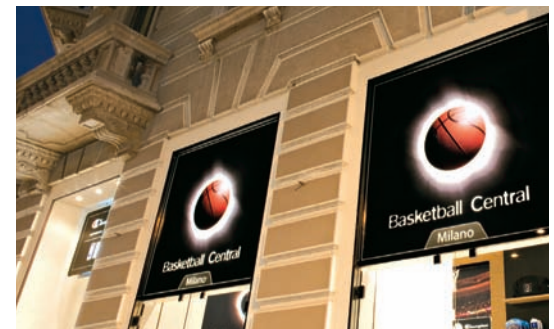
L'insegna non riconduce immediatamente a Champion