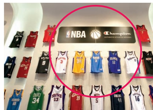
Le canotte Nba sono usate come arredo