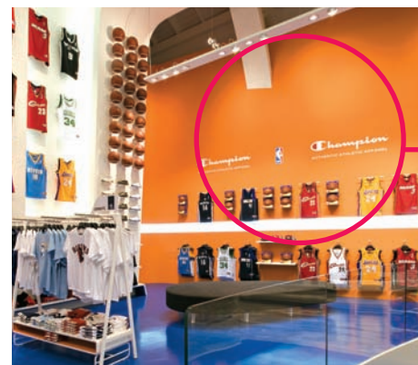
Il brand Champion è ripetuto ovunque

riosità di uno spazio ex cinema, Basketball Central ha saputo ricreare l'ambientazione e l'atmosfera che si respira in un palazzetto dello sport: peccato però non vi sia alcun riferimento ai tabelloni con i canestri, veri e propri simboli di questa attività sportiva. Ben sfruttate, invece, le pareti completamente avvolte da murales che riecheggiano da una parte un'azione in campo, dall'altra la storia del brand dal 1919 al 2007, mentre quella frontale propone una muraglia di canotte Nba fiancheggiata in entrambi i lati da una fila di palloni che raggiunge il soffitto. Nell'insieme l'immagine ne esce ben coordinata: tutto richiama al mondo Champion e alla sua identificazione con lo sport, basket e volley in primis. Il messaggio sembra non trasparire, però, al di fuori del negozio; le 12 vetrine che si affacciano su piazza Argentina e via Paganini non rendono viva l'emotività e il trasporto che il visitatore percepisce all'interno dello store. ■