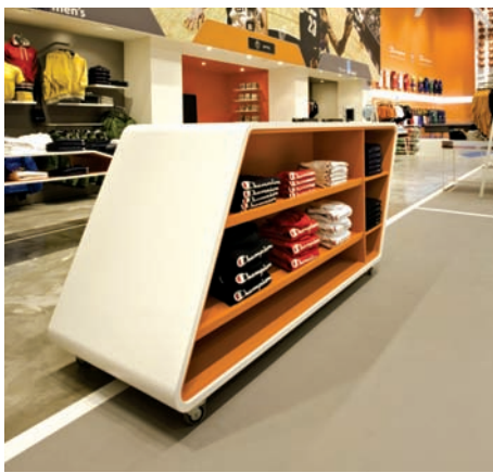
Mobili su ruote per cambiare la dinamica del p̄v