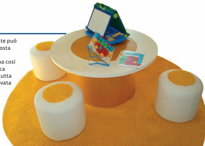
Immagine coordinata Ambiente Privacy Servizio

Entrando, sulla destra, il cliente può accedere all'area ludica composta da uno spazio bimbi e una zona ristorazione . Il cliente ha così la possibilità di recarsi in banca con i propri figli e lasciarli in tutta sicurezza nell'area a loro riservata mentre compie operazioni bancarie.