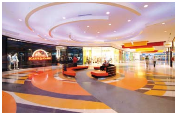
Valecenter a Marcon (Ve), storico centro commerciale, è stato oggetto di importanti lavori di refurbishment articolati in due fasi, nel 2006 e 2007

Per quanto riguarda la formazione dei tenant e del loro staff, Sonae Sierra ha dato priorità alla prevenzione, in modo che tutto il personale (anche i fornitori) sia istruito per poter identificare lacune o errori nelle loro stesse pro-