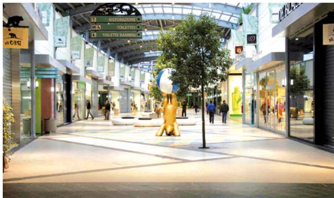
Un particolare della galleria commerciale de Gli Orsi a Biella, la più recente iniziativa firmata da Sonae Sierra in Italia

* Managing director Sierra Management Italy