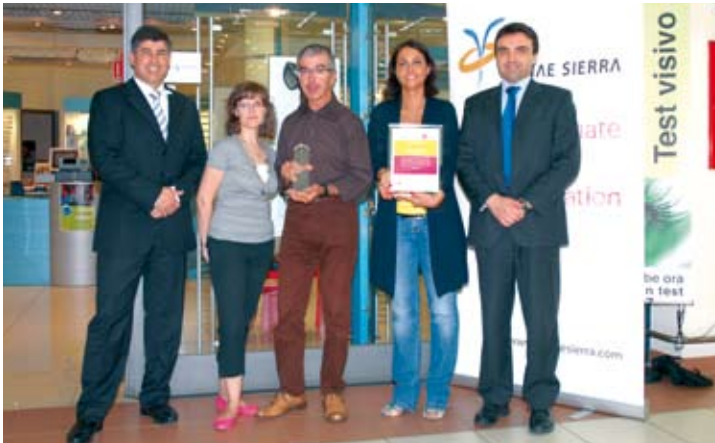
Personae Tenant Award: uno dei vincitori è Progetto Vista, nel centro commerciale L'Airone a Monselice (Pd)

mente a questa tematica. Per quanto riguarda l'Italia le ore di formazione sono state oltre 500.