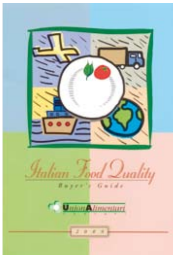
Comunicazione in primis

del contratto, per ragionare e arrivare alla data fissata puntuali e con delle proposte fattibili”.