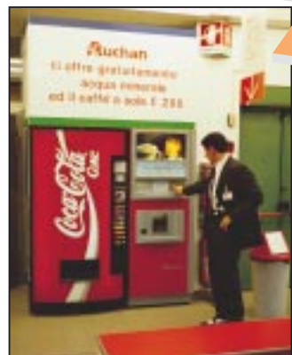
Ospitalità/2. Un distributore automatico, attrezzato con sedute autonome, permette un momento di ristoro.