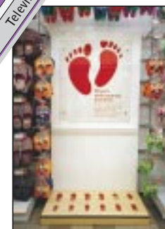
Prova. A lato: i bambini, divertendosi, possono indovinare il numero di piede della scarpa da provare.