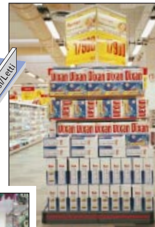
Testata. Sopra: le testate di gondola sono state ristudiate.